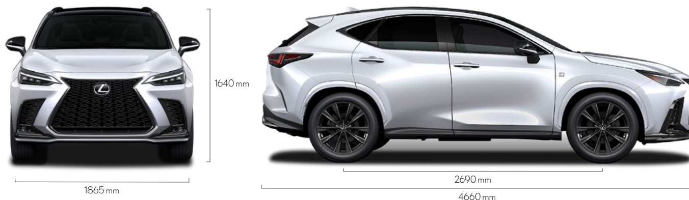
NX 350h 2WD