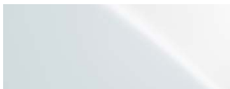
085 SONIC WHITE