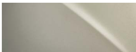
4X8 ICE ECRU