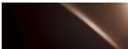
4X2 COOPER BROWN