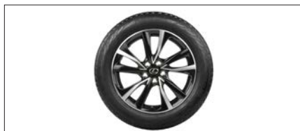
KOMPLETNE KOŁA ZIMOWE LEXUS Z CZUJNIKAMI CIŚNIENIA 18" BKOLONX18CB 8 400 PLN BRUTTO