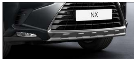
SPOJLER PRZEDNIEGO ZDERZAKA PW41578000 2 467 PLN BRUTTO