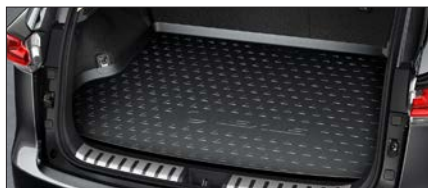
GUMOWA WYKŁADZINA BAGAŻNIKA PW24178000 416 PLN BRUTTO