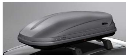
BOX BAGAŻOWY PZ41B0063800 1 735 PLN BRUTTO