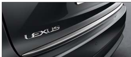
CHROMOWANA LISTWA POKRYWY BAGAŻNIKA PZ415X249100 724 PLN BRUTTO