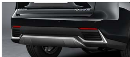
DYFUZOR ZDERZAKA TYLNEGO PW41578003 2 356 PLN BRUTTO