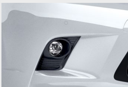
Lampy przeciwmgielne przednie LED