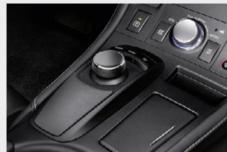
Obracany kontroler multimedialny