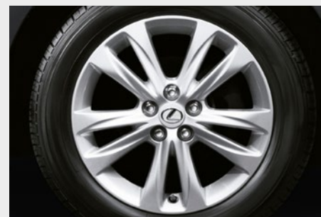
16-calowe obręcze kół