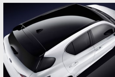
Możliwość rozszerzenia Pakietu Black o opcję czarnego dachu (1 300 zł)