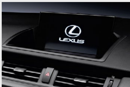
7-calowy ekran multimedialny