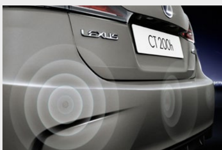
Czujniki parkowania (z przodu i z tyłu)