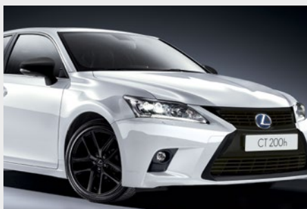
Czarne wykończenie lusterek zewnętrznych, tylnego dyfuzora oraz atrapy chłodnicy wraz z obramowaniem