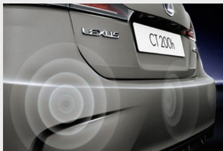
Czujniki parkowania (z tyłu)