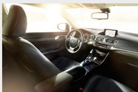
Podgrzewanie przednich foteli