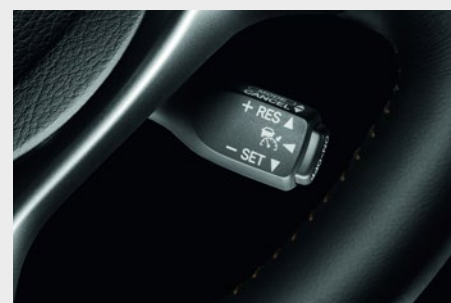
System kontroli prędkości (tempomat)