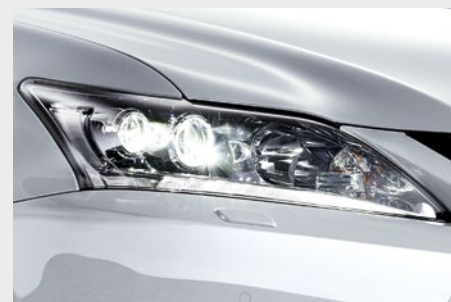
Światła mijania w technologii LED z automatycznym poziomowaniem i wysuwanymi spryskiwaczami