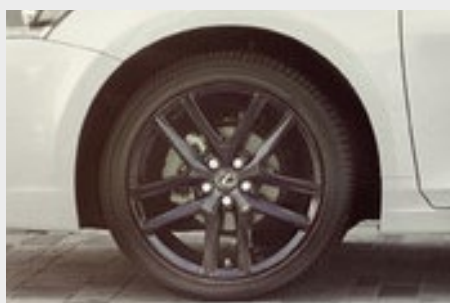
Czarne 17-calowe obręcze kół